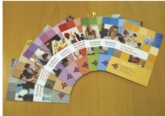
Na Treoir Tapa OSFC

I rith deireadh 2008 agus 2009, d'fhorbair an Oifig sraith nua leabhráin treoracha do geallsealbhóirí cuideachta. Léiríonn na leabhráin nua i bhfoirm achoimre príomh-eolas ar ról cuideachtaí, stiúirtheoirí, rúnaí, iniúchóirí, creidiúnaithe, bail/scairsealbhóirí agus leachtaitheoirí, glacadóirí agus scrúdaitheoirí. Comhlánaíonn said ár buan-Leabhair Eolais 1 ina pléitear na hábhair céanna go mionchruinn.